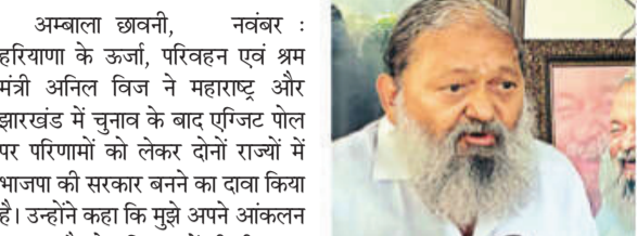
हरियाणा के ऊर्जा, परिवहन एवं श्रम मंत्री अनिल विज

कांग्रेस झूठ बोलने यूनिवर्सिटी है जिसमें चैप्टर है कि जब हार जाओ तो ईवीएम को लेकर रोना है, यह (कांग्रेस) तो अपने स्लेबस के मुताबिक चल रहे हैं : विज