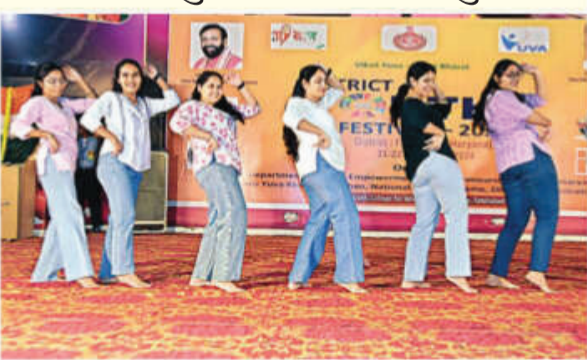
कामना की और कहा कि प्रतियोगिताओं के माध्यम से युवा चर्चानित होते हुए राष्ट्रीय युवा महोत्सव में भाग लेकर जिला व देश का नाम रोशन करें।

फतेहाबाद, नवंबर : युवा अधिकारिता एवं उद्यमिता विभाग, हरियाणा द्वारा आयोजित जिला स्तरीय युवा महोत्सव का दो दिवसीय कार्यक्रम राजकीय महिला महाविद्यालय, भोंडिया खेड़ा के सभागार हाल में आयोजित किया गया। जिला स्तरीय युवा महोत्सव में राज्यसभा सांसद सुभाष बराला ने बतौर मुख्यतिथि शिरकत की और दीप प्रज्वलित कर कार्यक्रम का शुभारंभ किया। इस महोत्सव में प्रतिभागियों द्वारा हरियाणवी वेशभूषा में रंगारंग सांस्कृतिक कार्यक्रमों की प्रस्तुति दी। उपस्थितजनों ने तालियों की गड़गड़ाहट से प्रतिभागियों का हौसला बढ़ाया। इस मौके पर मुख्य अतिथि राज्यसभा सांसद सुभाष बराला ने युवा शक्ति को अपने जीवन में अनुशासन का पालना करने हेतु प्रेरित किया। उन्होंने कहा कि यदि हम अपनी लोक संस्कृति से जुड़कर रहेंगे तो समाज और देश के अच्छे नागरिक बन पाएंगे। सांसद ने कहा कि हमारी भारतीय संस्कृति दुनिया की सर्वश्रेष्ठ संस्कृति है। उन्होंने कहा कि युवाओं को सांस्कृतिक व खेलकूद गतिविधियों में बढ़ चढ़कर भाग लेना चाहिए। इन सभी गतिविधियों में भाग लेने से युवाओं का सर्वांगीण विकास होता है। उन्होंने सभी प्रतिभागियों के उज्ज्वल भविष्य की