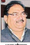
अश्वयुक्त सिंह चौटाला

चंडीगढ़, नवंबर : इनेलो के राष्ट्रीय प्रधान महासचिव अश्वयुक्त सिंह चौटाला ने कहा कि हरियाणा सरकार में सभी सरकारी विभाग भ्रष्टाचार का अंडू बने हुए हैं। कोई एक दिन ऐसा नहीं जाता, जब अखबार में किसी न किसी सरकारी विभाग के अंदर हो रहे भ्रष्टाचार की खबर न छपती हो। बावजूद इसके सरकार द्वारा कोई लगाम नहीं लगाई जा रही। इसका सबसे बड़ा कारण है कि संतरी से लेकर मंत्री तक सभी जमकर लूटने में लगे हैं। प्रदेश में भ्रष्टाचार की जड़