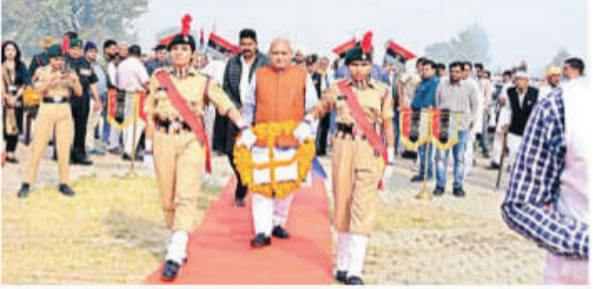
शहीद सम्मान समारोह में शिरकत करते हुए लोक निर्माण एवं जनस्वास्थ्य अभियांत्रिकी मंत्री रणबीर गंगवा।

हिसार, नवंबर : लोक निर्माण एवं जनस्वास्थ्य अभियांत्रिकी मंत्री रणबीर गंगवा ने बरवाला विधानसभा क्षेत्र के गांव मिर्जापुर एवं निगाना का धन्यवादी दौरा कर स्थानीय नागरिकों की समस्या सुनकर समाधान की दिशा में निर्देश दिए।