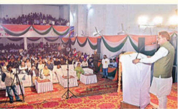
फतेहाबाद राजकीय महिला कॉलेज भोंडिया खेड़ा के सभागार में दो दिवसीय जिला स्तरीय युवा महोत्सव को संबोधित करते मुख्यतिथि राज्यसभा सांसद सुभाष बराला (दाएं) फतेहाबाद राजकीय महिला कॉलेज भोंडिया खेड़ा के सभागार में आयोजित दो दिवसीय जिला स्तरीय युवा महोत्सव में प्रस्तुति देते युवा।

राज्यसभा सांसद ने किया दो दिवसीय जिला स्तरीय युवा महोत्सव का शुभारंभ